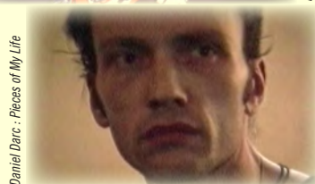
Daniel Darc : Pieces of My Life