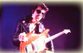
Rumble, The Indians Who Rocked the World