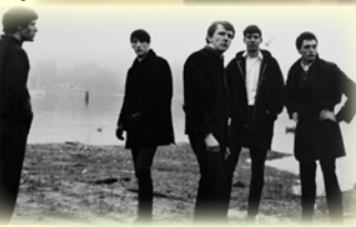
Boom, A Film About The Sonics