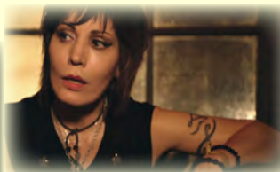
Joan Jett : Bad Reputation