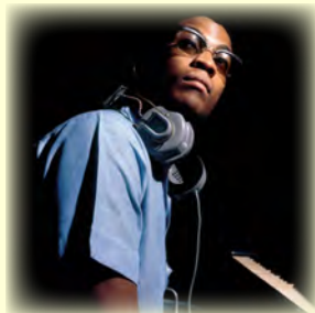
Blue Note Records, Beyond the Notes