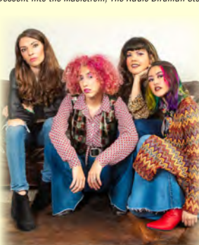
The Glam Skanks