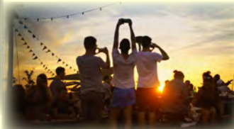
Symphony of Now