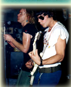
Descent into the Maelstrom, The Radio Birdman Story